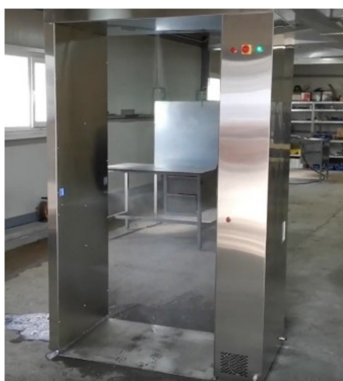
Dezinfekcioni tunel – Corten Art

Mladi šabački inovatori napravili prvi srpski dezinfekcioni tunel, za njihov proizvod vlada veliko interesovanje u zemlji i inostranstvu