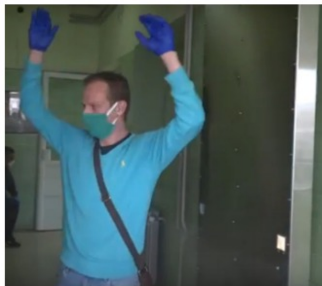
Covid ambulanta – Dom zdravlja

– Naš tunel raspršuje mikrodezinficijens na odeću i obuću korisnika i na taj način, ubija virus na potencijalnom prenosioocu. Napravljen je od nerđajućeg čelika, a na principu mlaznica poput onih za rashlađivanje u baštama kafića. Po prolasku kroz tunel, otklonjena je opasnost od kontaminacije virusima, bakterijama. Posebno je koristan i aktuelan u toku