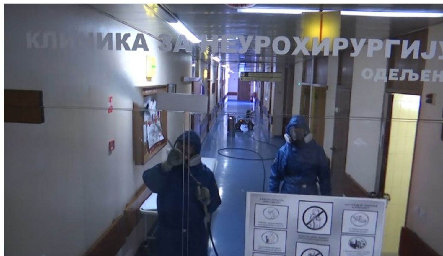
Ministarstvo odbrane Srbije

Fond za inovacionu delatnost finansijski je podržao 12 projekata u Srbiji kako bi inovativna preduzeća u što kraćem roku odgovorila na probleme izazvane pandemijom korona virusa u zemlji.